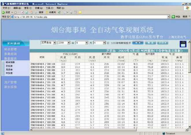
可以作成时间报、日报、月报、年报。