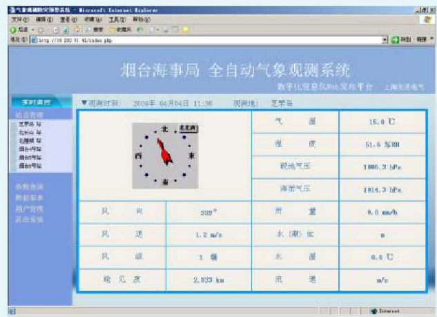
点击安装在各处的自动站,查看实时数据及报警。